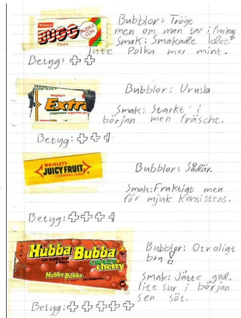
Två exempel på dokumentationer av tuggummitestet

Det finns fler exempel på genomförbara "Tester" på s 29 i boken Tummen upp NO åk 6 . Om någon av er som tar del av detta testar testet i klass kan ni väl dela med er av erfarenheterna? Bilder, hur ni gjorde, dokumentationer, reflektioner.